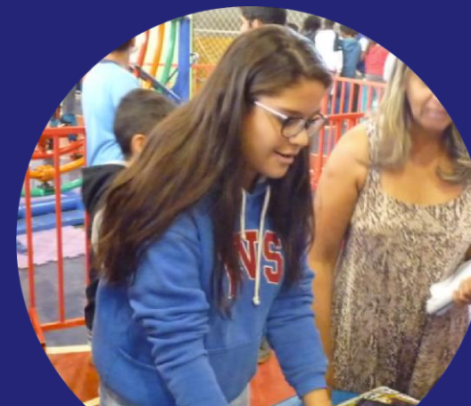
ADOLESCENTES E JOVENS